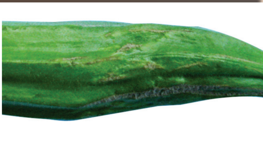
ការខូចខាតដោយសារត្រជុសខ្យល់