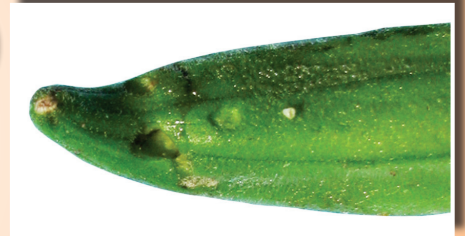
ការខូចខាតដោយសារដង្កូវមេអំបៅ