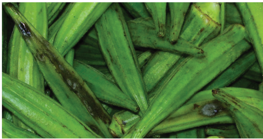
រលួយព្រោះផ្លែឈើត្រូវបានគេខ្ទប់ទាំងទឹកឬស្តុកទុកក្រោមសីតុណ្ហភាព ១០ដឺក្រេសេ។