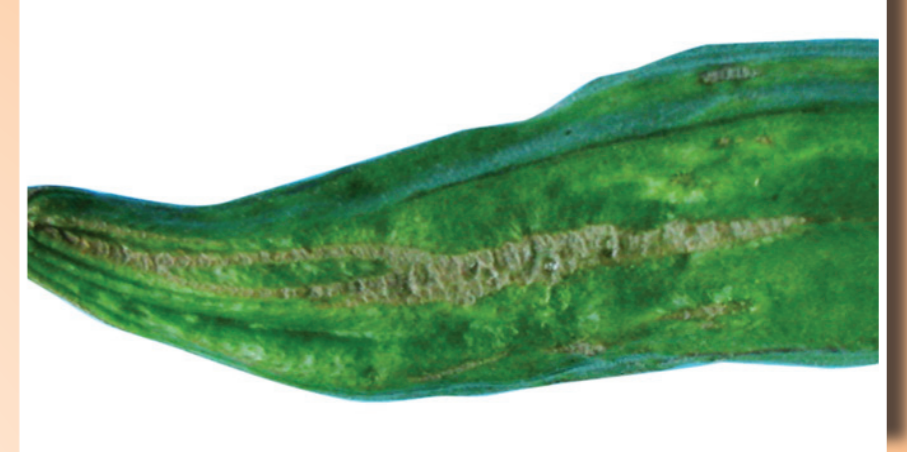
ការខូចខាតដោយសារសត្វល្អិតស៊ី